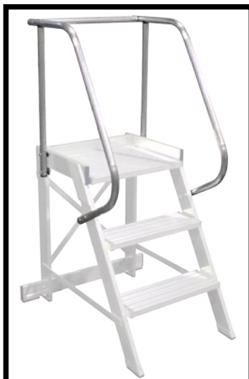
ACC07 Salva-rodillas (H=65cm)