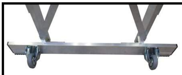
ACC04 Ruedas Ø80mm