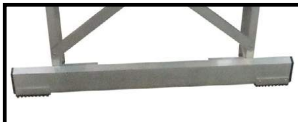
ACC03 Estabilizador GRA6002 y GRA4502